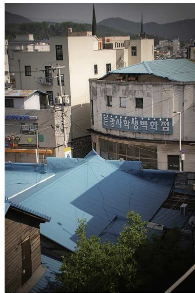
감영길 21 옛 호서극장