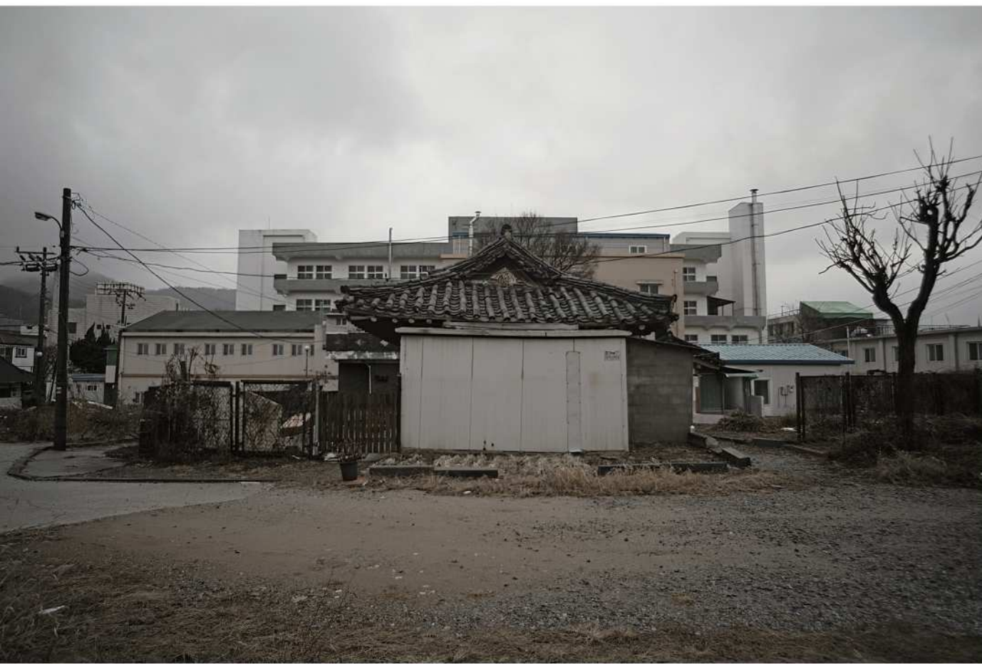
웅진로 옛 공주의료원.Ⅱ