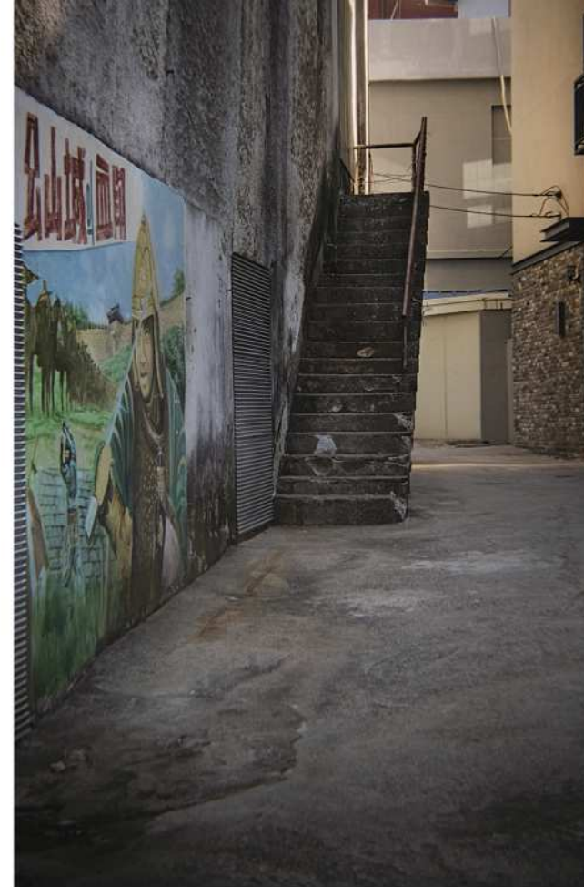
감영길 21 옛 호서극장 뒷골목