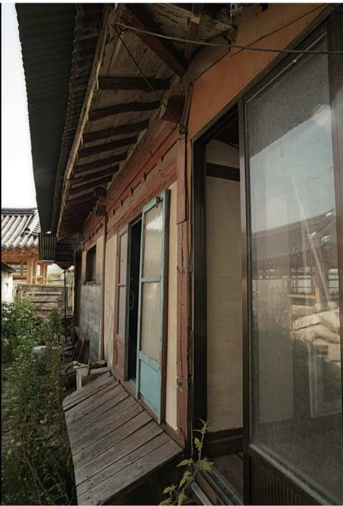
감영1길 김갑순 생가.Ⅱ