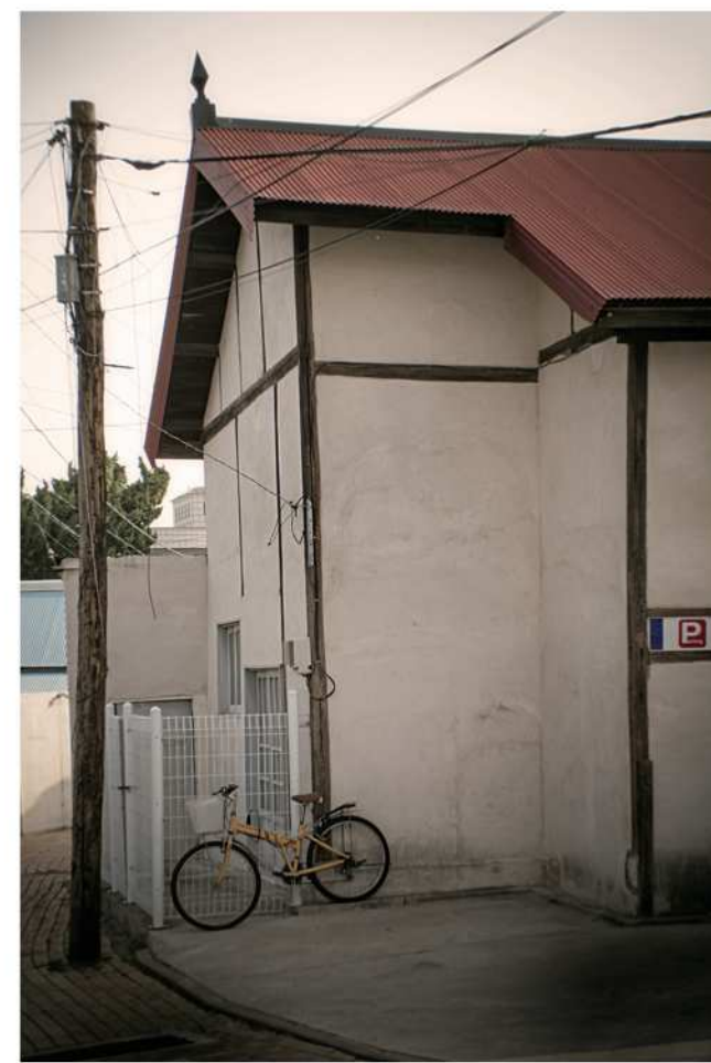
우체국길 연춘당한의원 주차장