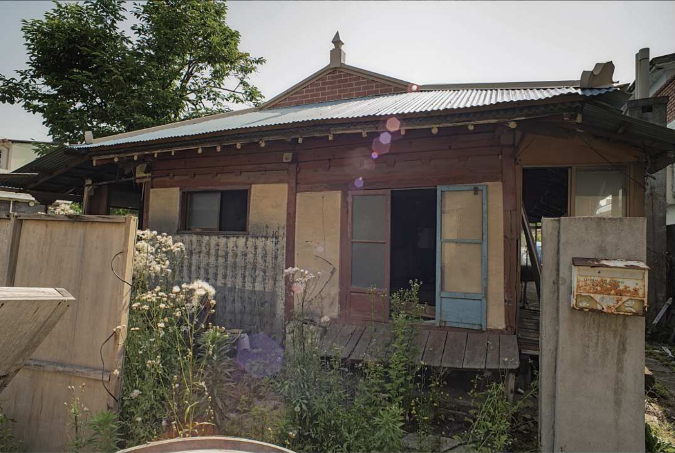
감영1길 김갑순 생가.Ⅰ