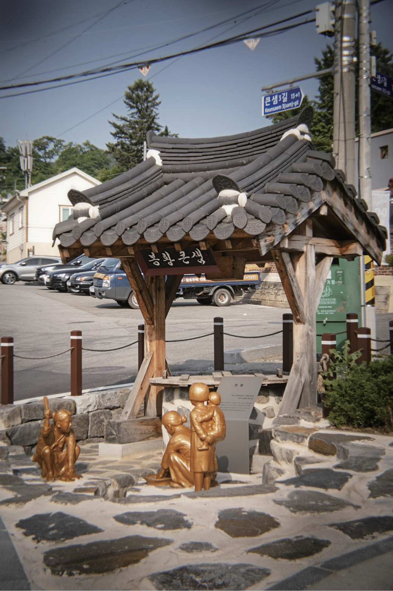
Keunsaem 2-gil Bonghwang Keunsaem