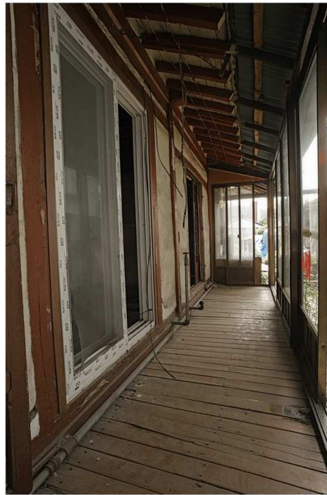
감영1길 김갑순 생가.Ⅲ