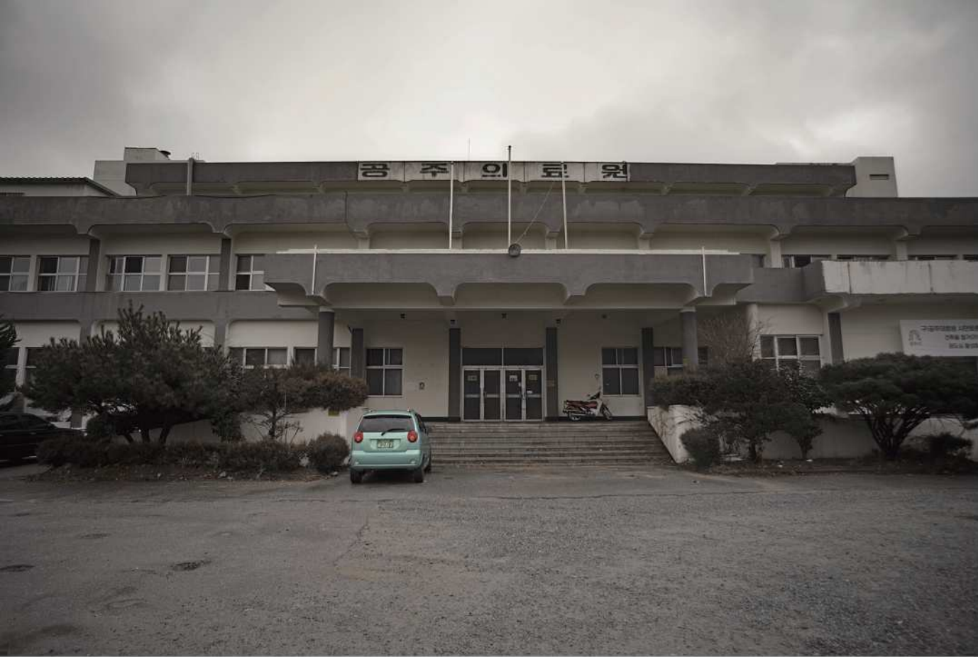
웅진로 옛 공주의료원.Ⅰ