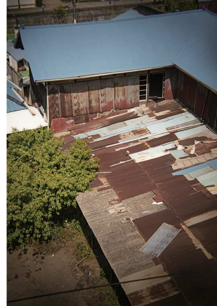
감영길 22 옛 양조장