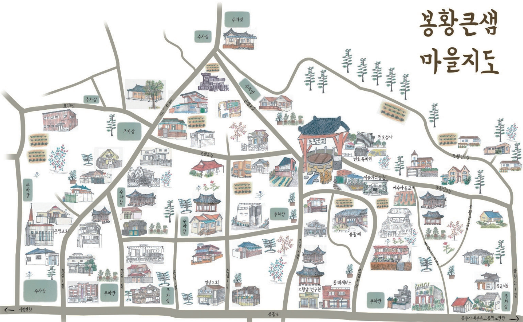
봉황큰샘 마을지도는 소규모 도시재생사업 일환으로 지역주민들과 예술가 참여로 만들어졌습니다